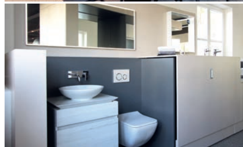
Wohnberatung, Studio Köln