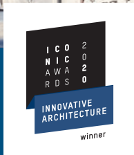
ICONIC AWARD: SIDOL LOFTS & GRENADA, PARK LINNÉ, Köln