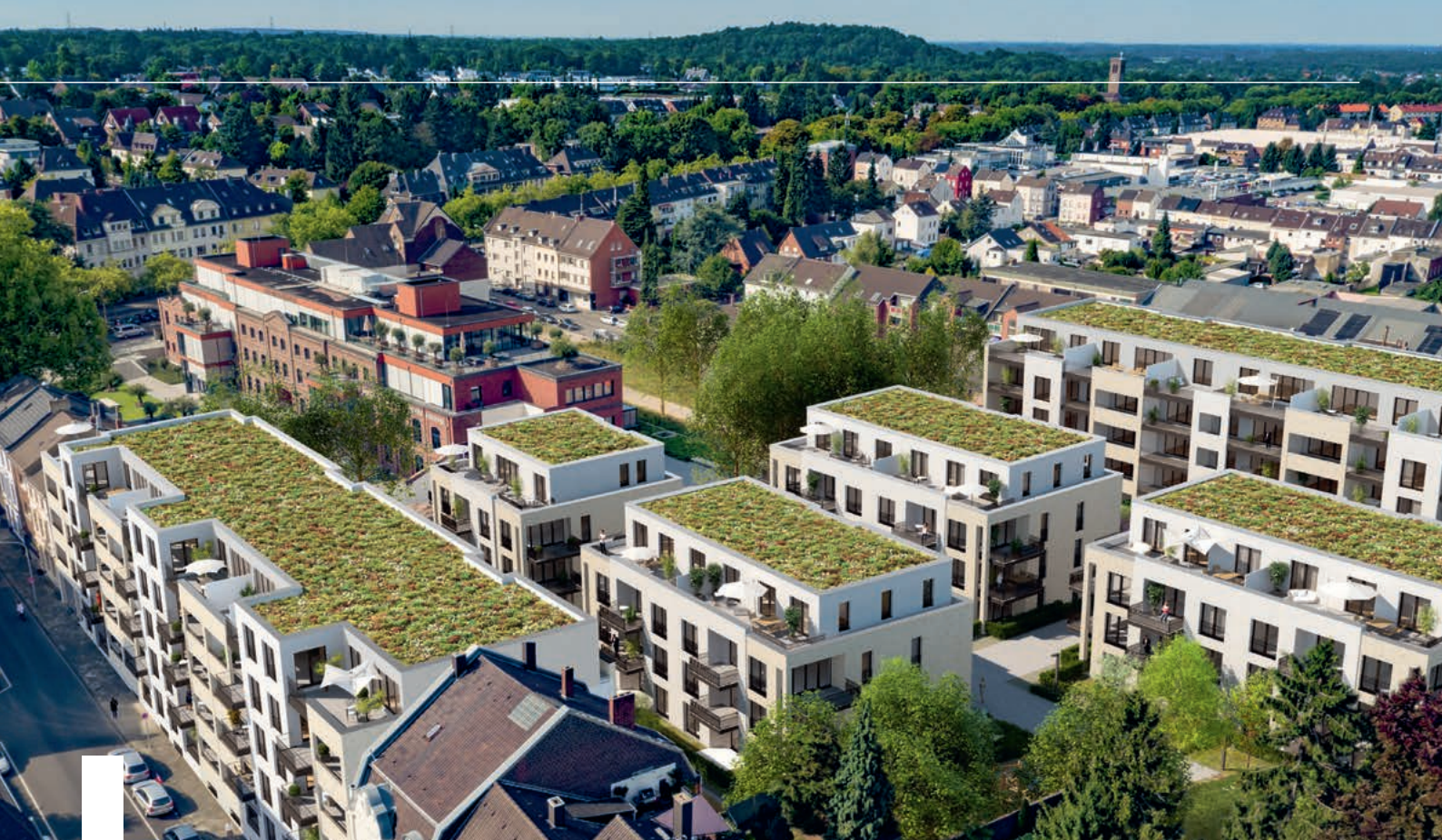
Neuhoof-Quartier in Mönchengladbach