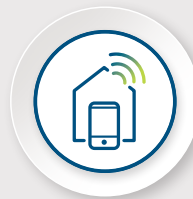
Wohnen & Arbeiten

Als zukunftsorientierter Projektentwickler bringen wir Innovationen aus den Bereichen Wohnen und Arbeiten, Mobilität, Energie, Gemeinschaft und Umwelt in die Planung von Quartieren ein. Unser Ziel ist es, angepasst an die örtlichen Bedürfnisse dauerhaft wirtschaftlichen und attraktiven Lebensraum zu realisieren.