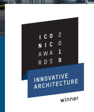
ICONIC AWARD: Theresiengärten, Hürth