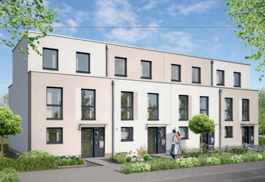
Haustyp VISTA CUBO L, Straßenseite