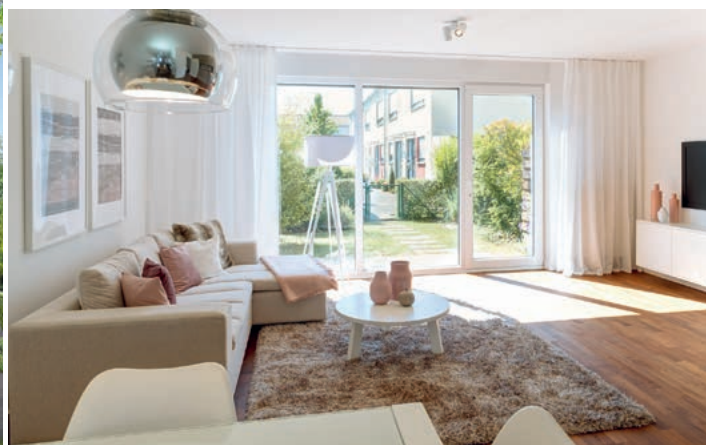
VISTA L Musterhaus, Wohnzimmer