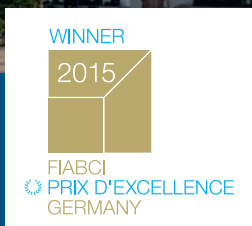
FIABCI Prix d'Excellence: COLÓN, PARK LINNÉ, Köln