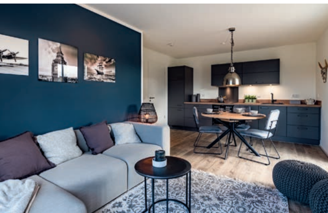
FAIRHOME Musterwohnung (l.) Rheinische Straße, Gelsenkirchen (u.)

Virtuelle Tour durch unsere FAIRHOME Musterwohnungen